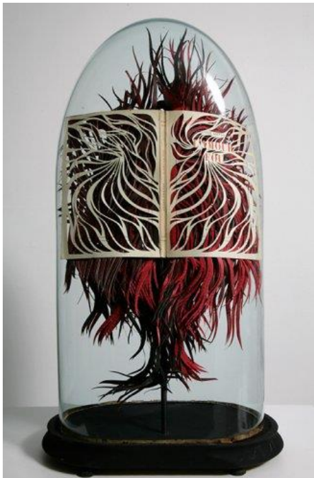
Georgia RUSSEL, L'Amour fou (André Breton) , 2009 Cut and painted book in oval bell jar