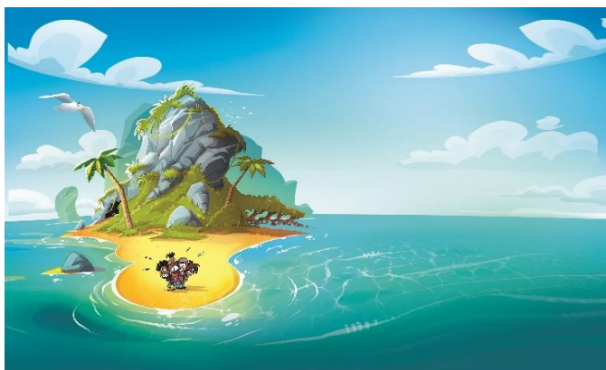
Illustration : Nicolas Yann Martin

Comédie musicale - 60min - Tout public- À 18h