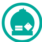
Transport de matières dangereuses