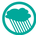
Fortes pluies et orages