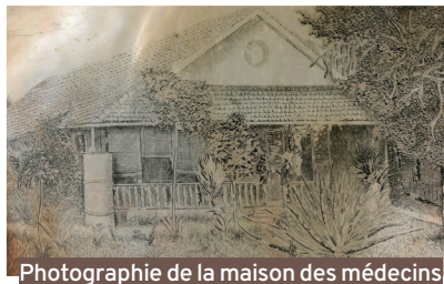
Photographie de la maison des médecins de l'hôpital du Marais, à l'île Nou, par le Dr Félix Gaillard, médecin auxiliaire au bagne entre 1884 et 1887.