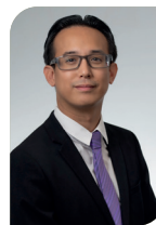
JULIEN TRAN AP