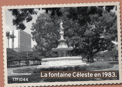
La fontaine Céleste en 1983.