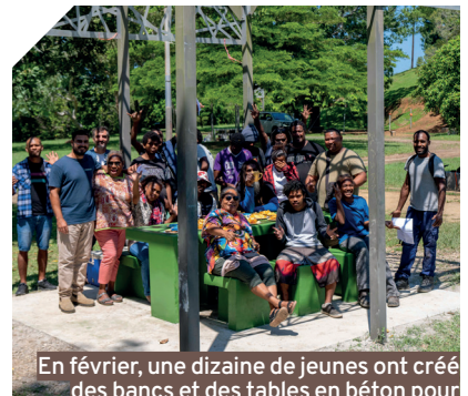
En février, une dizaine de jeunes ont créé des bancs et des tables en béton pour aménager le parc de Rivière-Salée.

Douze chantiers d'initiation sont prévus entre mars et décembre, tels que la réalisation d'estrades pour le Pôle jeunesse et de protections naturelles pour le littoral. « Pour définir les chantiers, on écoute également les besoins des habitants, développe le responsable de la mairie. Ça permet de valoriser les jeunes et la démocratie participative. Je prends l'exemple du parc de Rivière-Salée où, dernièrement, on a réalisé des tables en béton et celui des tours de Magenta avec la création d'un abri dans les jardins familiaux. » Des chantiers techniques dirigés par l'association Active.